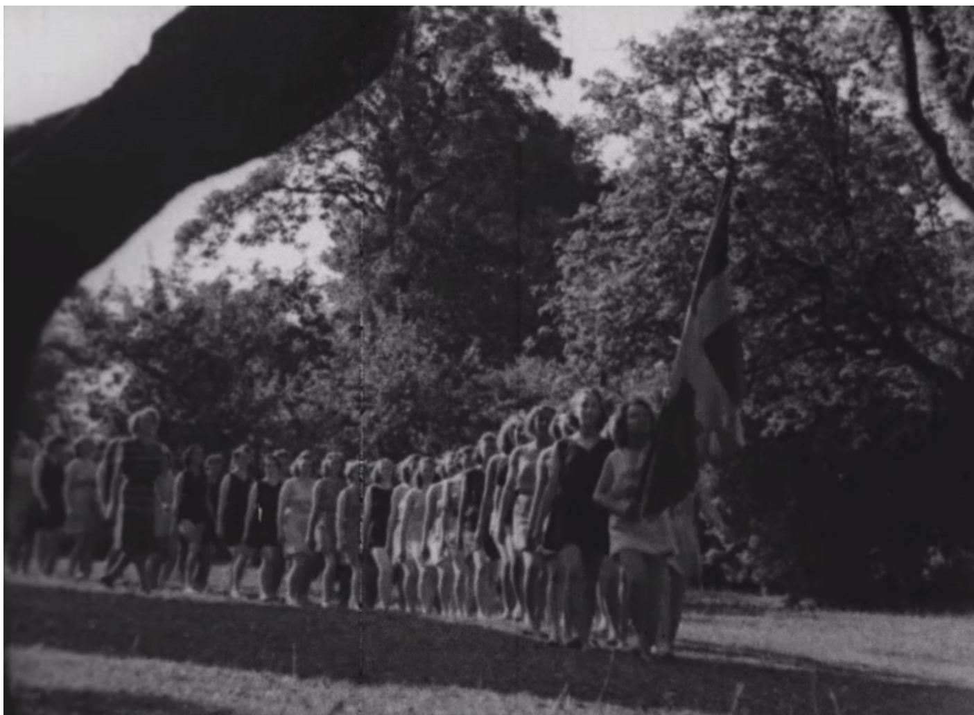
En flok kvinder fra højskolen går på rad og række. Den forreste går med Dannebrog.

Har du været på højskole eller på en anden uddannelsesinstitution, hvor du boede? Fortæl om det.