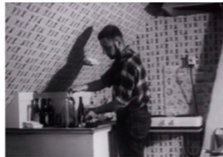
En ung mand står ved vasken i sin lejlighed. Der står al på bordet

Hvilke fritidsinteresser havde du, da du var ung?