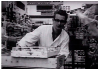
En ung mand arbejder i et supermarked

Måtte du arbejde meget for at tjene penge nok, da du var ung?