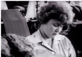
En kvinde arbejder på en fabrik for at tjene penge

Fortæl om det første sted, du boede, da du flyttede hjemmefra